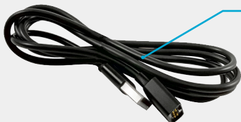
Кабель зарядки и передачи данных