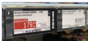
Изменение макета шаблона