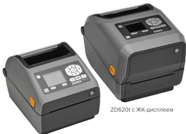
ZD620d с ЖК-дисплеем

Если вам необходимо отличное качество печати и высокая производительность, гибкое применение и простое управление, ваш выбор – это принтеры Zebra ZD620. Серия ZD620 представляет собой новое поколение передовых настольных принтеров Zebra и заменяет получившую большую популярность на рынке линейку принтеров серии GX и принтеры ZD500. Новые принтеры оснащены передовыми функциями и заметно превосходят традиционные настольные принтеры, предлагая непревзойдённое качество печати. Принтеры доступны как модели прямой термопечати, так и модели для термотрансферной печати, а также специализированные модели для применения в сфере медицинского обслуживания. Рассчитанные на разные виды применения эти принтеры включают большинство стандартных функций, которыми наделены любые другие модели настольных принтеров Zebra. Более того, эти принтеры доступны с 10-кнопочной панелью управления и цветным ЖК-дисплеем, заметно облегчая оператору настройку конфигурации и вывод данных о состоянии принтера. Принтер ZD620 базируется на платформе Link-OS® и включает наш обширный комплект приложений, инструментов разработчика и сервисных программ Print DNA, благодаря которым вам гарантирован прекрасный уровень производительности, лёгкое управление в дистанционном режиме и простая интеграция принтеров. Принтер Zebra ZD620 гарантирует высокую скорость и превосходное качество печати, оптимальные функции для управления работой принтера, благодаря чему вы сможете успешно выполнять поставленные задачи.