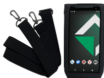
Аксессуары для ношения